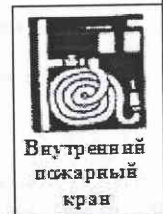
Внутренний пожарный кран